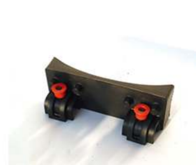
cerniera fusto-carrello con blocco