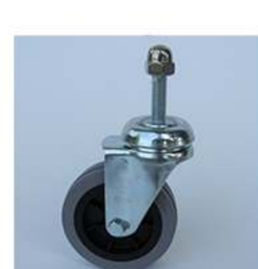
ruota scorrevole antitraccia Ø 80 mm