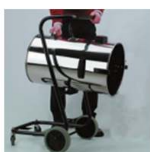
carrello metallo con fusto basculante