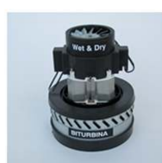
motore bistadio by-pass 1300w max