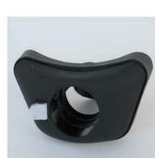
bocchettone a scatto antigoccia in nylon Ø 60