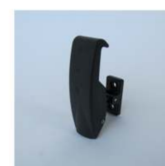
gancio chiusura robusto