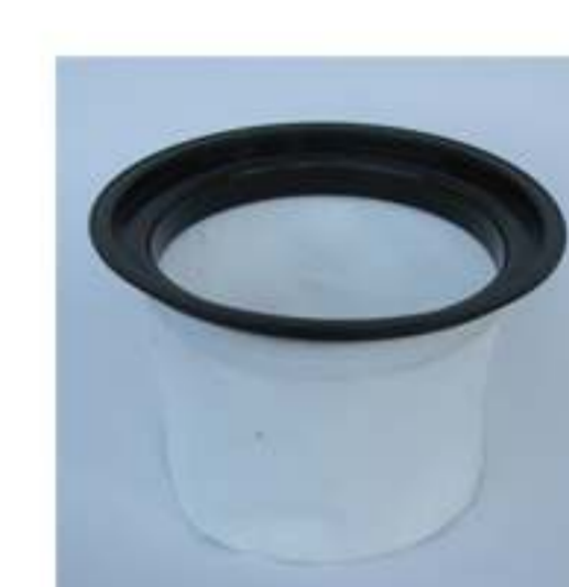
filtro poliestere lavabile cm 2 2300